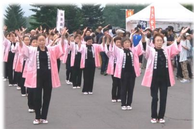
特別出演：新得音頭保存会